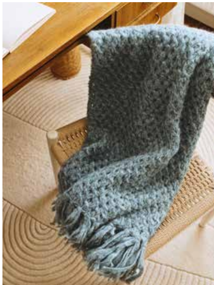
4 LALA BERLIN FURRY 190 x 70 cm