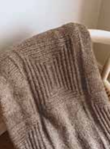
3 BABY LIGHT 184 x 142 cm