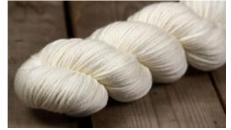
Rosy Green Wool Big Merino Hug PUR - 100g Bio Merinowolle GOTS