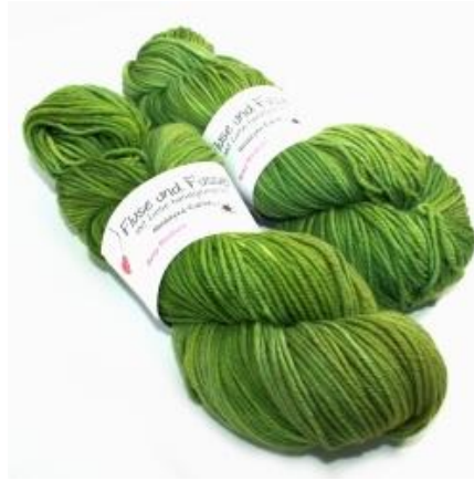
FuF Handdyed-Edition - Rosy Medium handgefärbt 100g