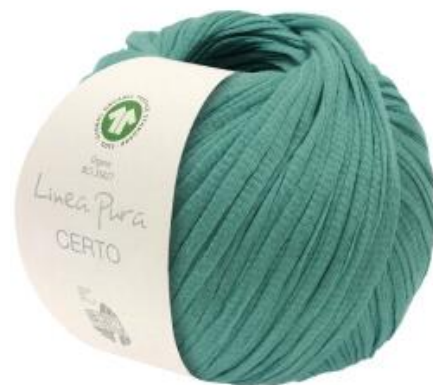
Lana Grossa Linea Pura - Certo GOTS 50g aus Bio-Baumwolle