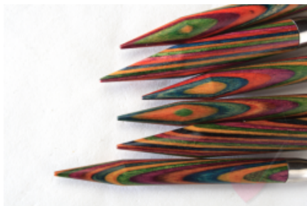
KnitPro - 1 Paar Nadelspitzen aus Symphonie-Holz für Wechselsystem