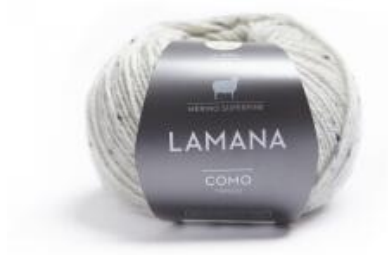
Lamana Como Tweed 25g - Tweedgarn aus reiner Merinowolle