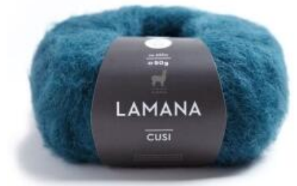
Lamana Cusi 50g - zartes Alpakagarn mit Flauscheffekt