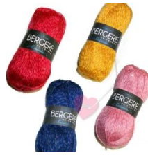
Estivale sommerliches Garn mit Hanf und kleinen Pailletten