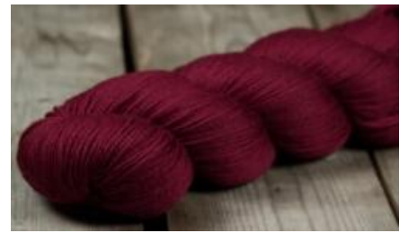
Rosy Green Wool Cheeky Merino Joy PUR - 100g Bio Merinowolle GOTS