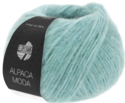
Lana Grossa Alpaca Moda 50g