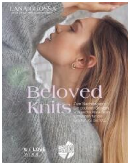
Lana Grossa Heft Beloved Knits