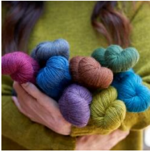
WYS "Fleece" Bluefaced Leicester DK - Color Collection