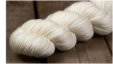
Rosy Green Wool Big Merino Hug PUR - Bio Merinowolle GOTS